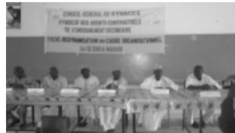
Une vue de la table de séance