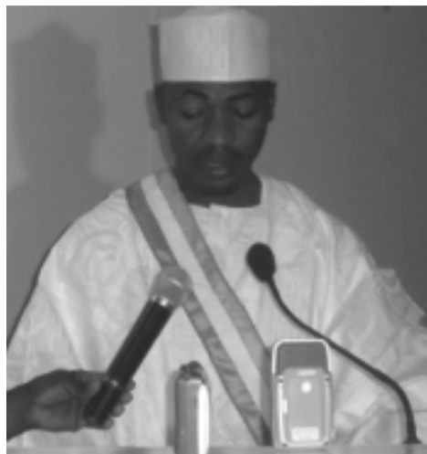
Kassoum Moctar, Maire de la Ville de Maradi

Dans l'allocution qu'il a prononcée à l'ouverture des travaux, le Maire de la Ville de Maradi, Kassoum Moctar, a particulièrement mis l'accent sur la nécessité d'une participation de tous dans