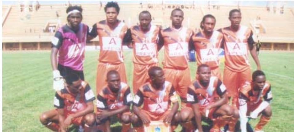
L'ÉQUIPE DE L'AS/FAN POSANT AVANT LE COUP D'ENVOI

Selon nos informations, des dispositions matérielles et techniques sont en train d'être prises par les dirigeants sahéliens pour une participation honorable. Des recrutements de joueurs sont en vue,