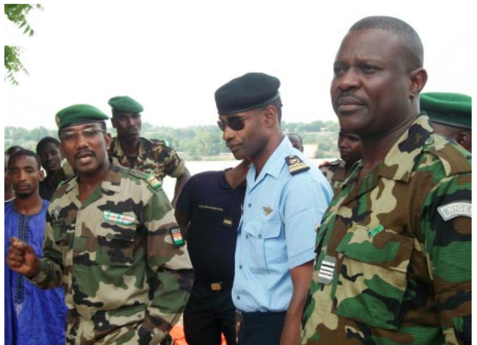
Le Gouverneur de la Région de Niamey, sensibilisant la population

j'ai nommé la Commission agro – Sylvio – pastorale l'arboriculture et le maraîchage ont été englouti par l'eau. Cette eau n'a pas aussi laissée certaines rizières à caractère non contrôlées. Certaines espèces pastorales ont été englouties. Ce mécanisme a entraîné la chute du rendement en pêche et en cueillette.