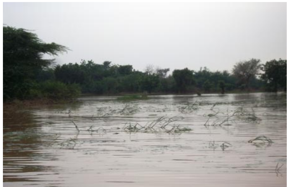
Vue d'une rizière (Rive Droite) engloutie

C'est ainsi qu'il a obtenu de la part de certains organismes tels que OXFAM, UNICEF, Croix Rouge, IRD et autres, 455 tonnes de vivres et aussi une