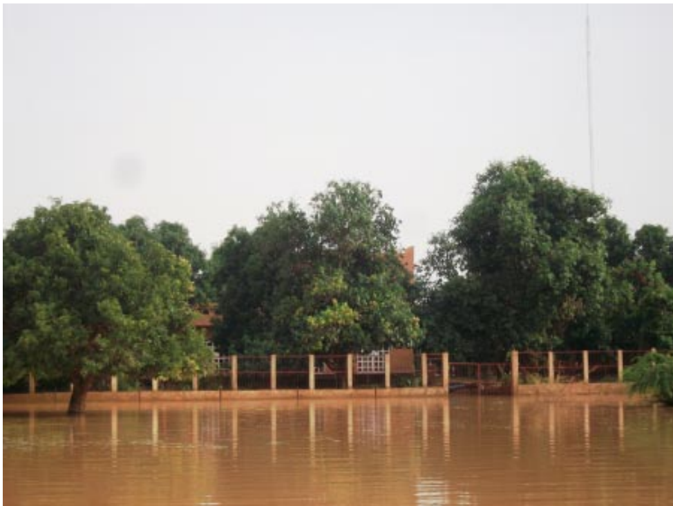
Un bâtiment de l'Etat engouti par l'eau

De prime abord, le comité de gestion de l'inondation a commencé à recenser les ménages concernés. Il a identifié 5 850 ménages à la commune V, 6 ménages à la commune I, 4 mé-