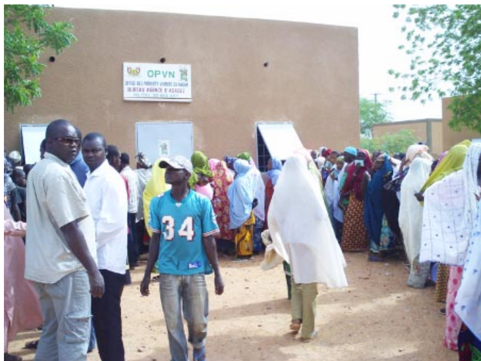
Une foule nombreuse à la queue leu leu à l'attente du service

phase, le stock étant épuisé, j'avais demandé au niveau du siège un programme de ravitaillement parce que ici à Agadez même s'il n'y a pas de problème de stock est considéré comme une région déficitaire. Parce que ce n'est pas une région qui a une vocation agricole. Dans un premier temps, j'ai eu un ravitaillement en mil, sorgho et maïs de l'ordre de 3 300 tonnes que j'ai eu à placer à l'OPVN et aux autres points de vente pour soulager la population surtout dans les zones d'Aderbissinat et Ingall où nous avons des éleveurs dans ces zones, mais aussi d'autres régions frontalières d'Agadez à savoir Zinder, Maradi et Diffa. Selon certaines informations, il y a même des éleveurs qui viennent des pays voisins comme le Tchad qui remontent un peu vers Ingall et nous cherchons toujours à mettre à leur disposition ces vivres. A part ces 3 300 tonnes, nous avons encore obtenu 1 265 tonnes que nous