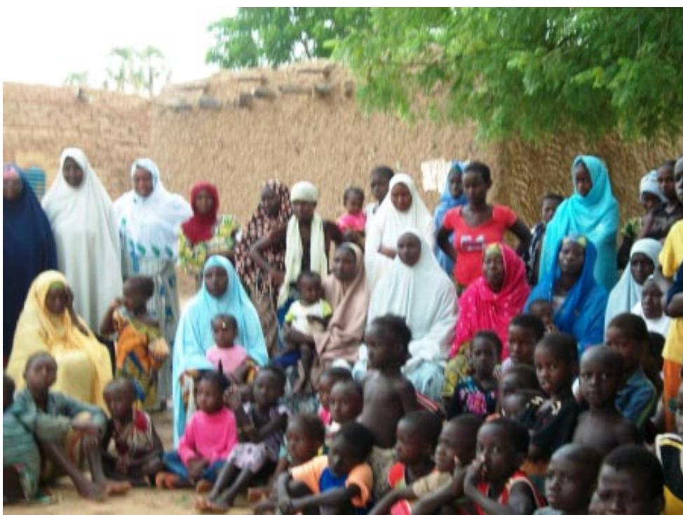
Une vue des sinistrés de la Commune Niamey V

Evidemment ces genres de catastrophes ne viennent pas sans pour autant toucher des sites maraîchers, mais Dieu merci, avec certains spécialistes en la matière, tels que les agents de la police on eu à maîtriser et sécuriser 15 sites maraîchers. D'après le Directeur régional de l'Environnement, qui se trouve à la tête d'une des plus grandes commissions