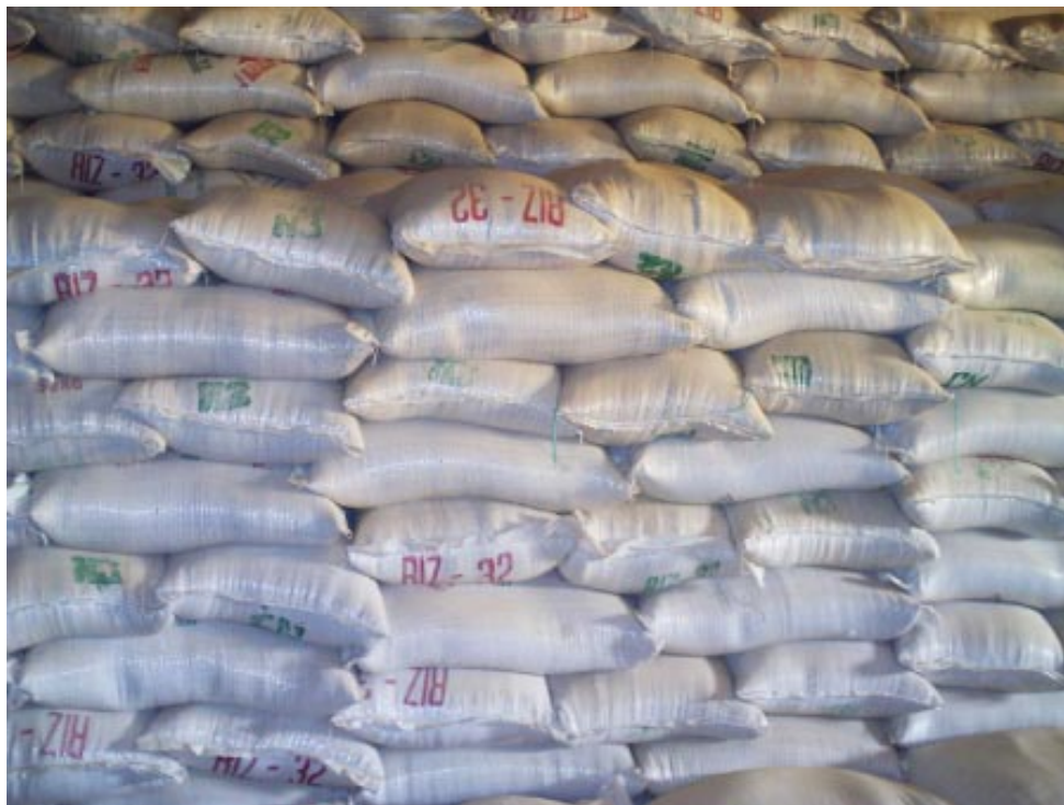
Un stock de l'OPVN d'Agadez servant à la vente à prix réduit

La population est très satisfaite par rapport à la distribution gratuite et par rapport à la vente à prix étudié qui se passe actuellement. Cette distribution gratuite ne concerne pas tout le monde car les fonctionnaires ne sont pas comptés. Mais il y a une population que nous essayons de satisfaire, il s'agit des forces de l'ordre et de sécurité qu'il faut satisfaire à tout prix. Nous avons pris des garde-fous en disant à la police si elle voit nos produits en vente sur le marché, elle n'a qu'à arrêter le commerçant.