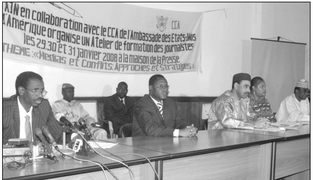
Une vue de la table de séance à l'ouverture

L'exercice de la profession de journaliste impose une exigence de vérité et un comportement citoyen irréprochable ". Le journaliste comme tout citoyen est tenu de respecter la loi, d'observer en tant que professionnel toutes les dispositions législatives régissant sa profession et de part son rôle social important, doit non seulement respecter la loi mais exige que des autres composantes de la société le même comportement