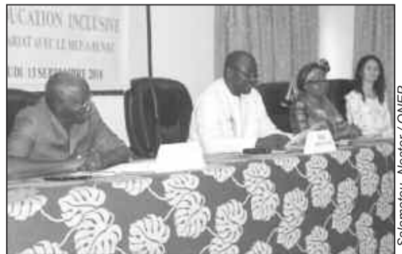
Une vue de la table de séance