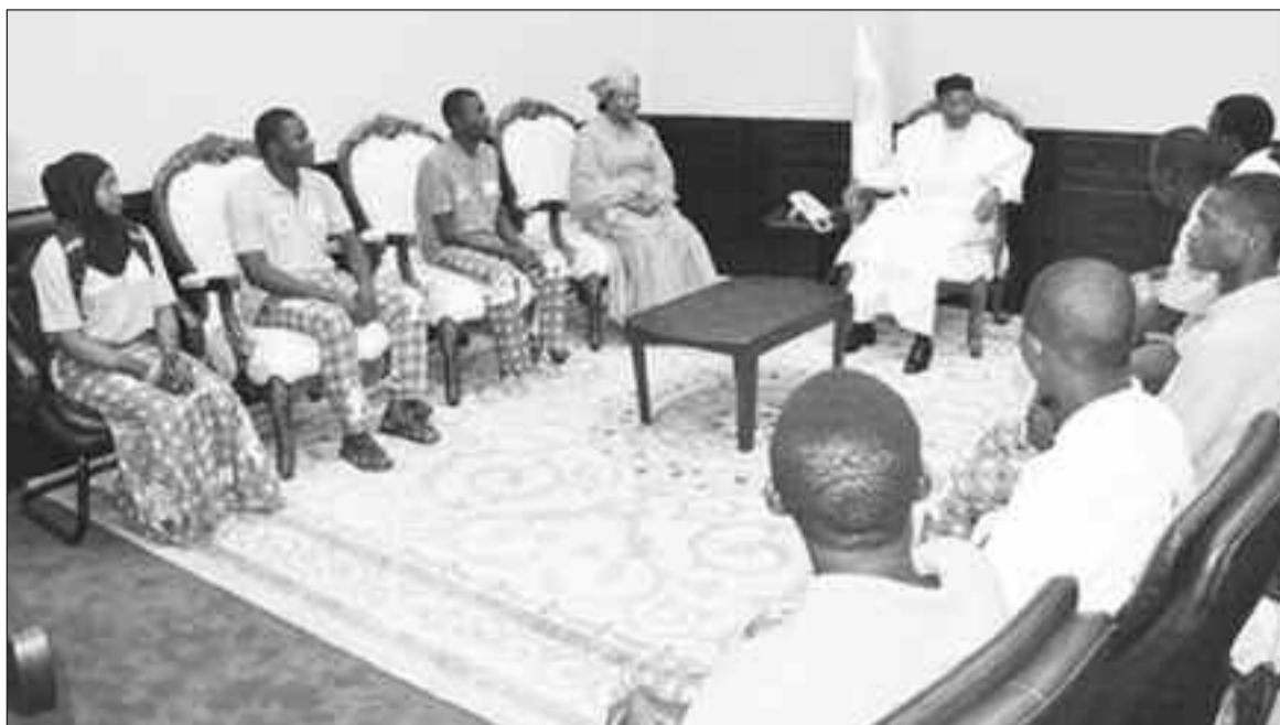
Le Chef de l'Etat s'entretenant avec des élèves lauréats

d'école qui éduque, forme et prépare la jeunesse à ses futures responsabilités, sans distinction de sexe. C'est pour cela que je me félicite du choix du thème de la présente cérémonie éduquer la jeune fille pour l'autonomisation de la femme», s'est réjoui le Chef de l'Etat. « Il n'ya pas de développement possible sans scolarisation, sans formation de la