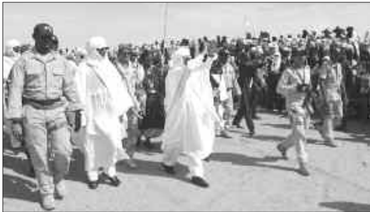
Le Premier ministre et sa délégation à leur arrivée à In'Gall

est particulièrement pertinent, car, nous savons tous dans quelles conditions de rigueur vivent les communautés pastorales. Nous savons et sans une certaine résistance, une certaine organisation, une certaine résilience, la vie serait tout simplement impossible dans ces espaces, pourtant magnifiques qui nous sont chers et nous tenons absolument à ce que la vie continue de prospérer dans ces espaces. Et là, le rôle de la femme est central » souligne le Premier Ministre. Il a, à cet effet, rendu un hommage mérité à la femme qui a-t-il dit, est le pilier de la famille. « C'est elle qui approvisionne la famille et le cheptel en eau, elle s'occupe de l'éducation des enfants » a-t-il déclaré rendant particulièrement hommage à la femme pastorale pour le travail hors du commun qu'elle abat tous les jours.