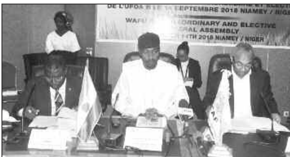
La table de séance à l'ouverture de l'AG

placée en notre pays pour abriter d'une part le tournoi qualificatif de l'UFOA B pour la CAN U17, et d'autre part pour la tenue de l'Assemblée générale Extraordinaire et Elective de l'UFOA B.