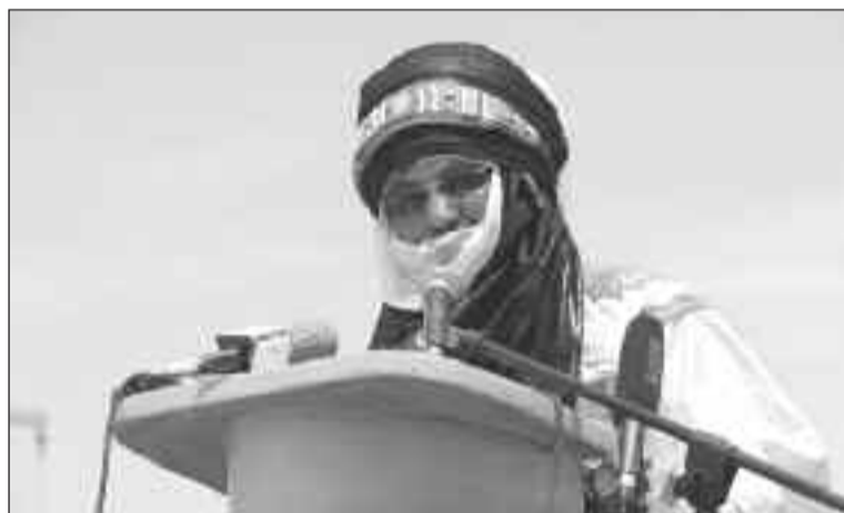
Le ministre délégué Mohamed Boucha

pèceset de races élevées est selon M. Mohamed Boucha sans doute un atout important tant au plan de l'alimentation que de celui de la création de revenus pour les ménages. Pour autant a-t-il déploré, malgré tous ces atouts, notre élevage demeure confronté et fragilisé par des défis multiples. Pour faire face à cette