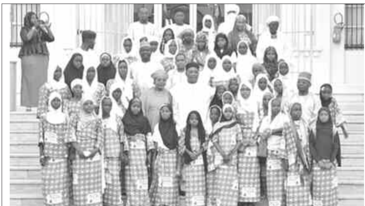
Photo de famille du Chef de l'Etat et de son épouse avec les jeunes filles

Pour accompagner ces jeunes brillants et leurs encadreurs, le Président de la république leur a offert une enveloppe de 20 millions de FCFA. Sur place, le ministre en charge de l'Enseignements Primaire, M. Mamadou Daouda Marthé a remis cette enveloppe à un représentant des concernés. Juste après, les 8 meilleurs en raison d'un par région ont eu droit à une visite guidée du bureau du Président de la république et la