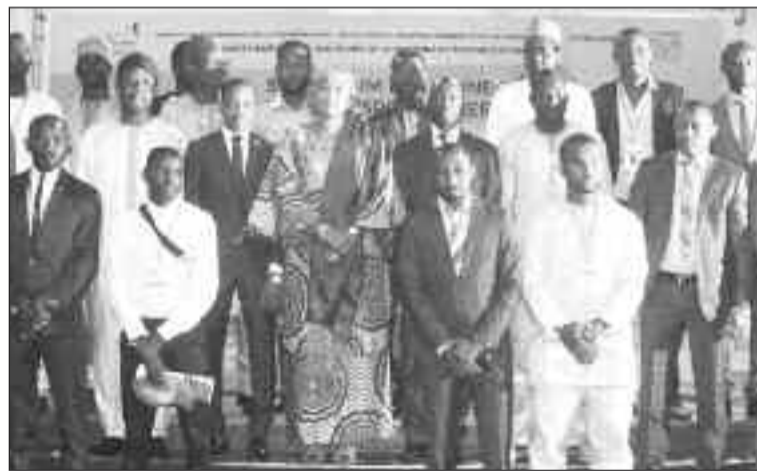
Photo de famille à l'issue de la rencontre