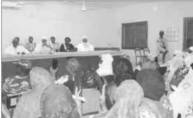
Lors de la rencontre

différents acteurs pour tous ceux qu'ils font pour accompagner les efforts du gouvernement pour l'amélioration des conditions de vie des populations. SE. Brigi Rafini a aussi évoqué d'autres sujets comme la sécurité ; la scolarisation particulièrement celle de la jeune fille et son maintien à l'école ; la gestion des ressources naturelles de plus en plus sous pression ; les changements climatiques ; la coexistence pacifique entre les communautés ; l'éducation de la jeunesse à cette aire des réseaux sociaux ; l'immigration irrégulière ; les trafics de toutes sortes ; l'extrémisme violent