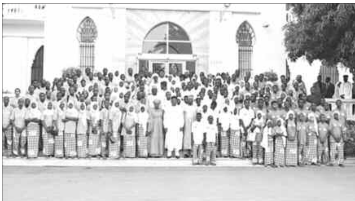
Photo de famille du Chef de l'Etat avec l'ensemble des lauréats

conscients en particulier les parents d'élèves. Il a lancé un appel à l'ensemble des parents pour qu'ils maintiennent leurs