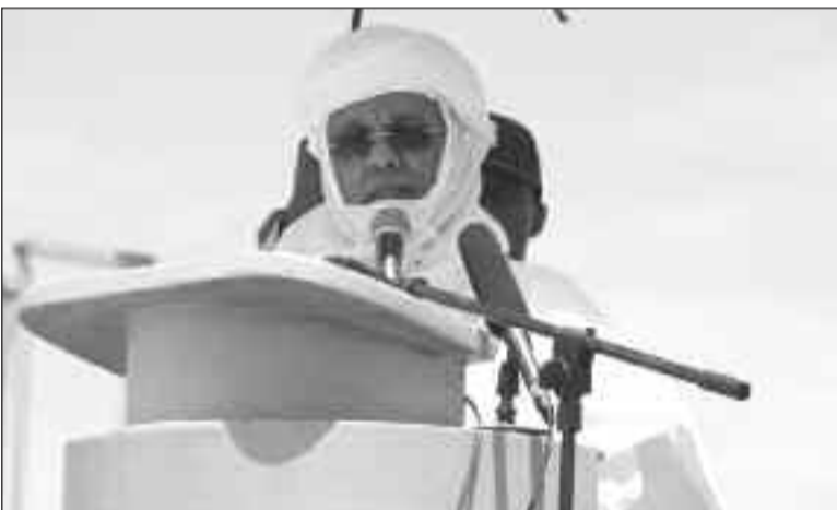
SE Brigi Rafini prononçant son discours

tous les efforts sont entrepris pour qu'il en soit ainsi » a ajouté SE Brigi Rafini. Le Premier ministre a, en outre, remercié tous les participants qui ont fait le déplacement d'Ingall, particulièrement les différentes délégations venues de toutes les régions et