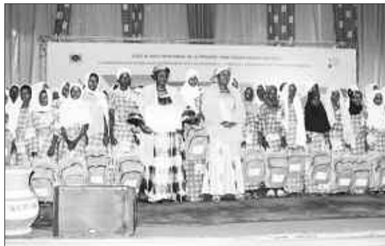
Lors de la cérémonie

La Fondation "Guri vie meilleure" de la Première Dame Aïssata Issoufou fidèle à ses engagements, a organisé jeudi dernier, une cérémonie en l'honneur de centaines de scolaires lauréats de la 8 ème édition de l'Excellence et du Mérite 2017-2018. Plusieurs importantes allocutions dont celle de la Marraine de l'Excellence Mme Issoufou Aïssata ont marqué l'éclat de cet événement d'envergure nationale. Ils sont au total Deux cent cinquante-neuf (259) lauréats issus de toutes les huit (8) régions du pays à recevoir leurs récompenses composées notamment des bourses, des ordinateurs portables, des Téléphones Android, des machines à coudre, des tablettes, des Clés USB, des livres, des sacs, des cahiers, des pagnes... Placée cette année sous le thème « l'éducation de la jeune fille pour l'autonomisation de la femme au Niger », cette cérémonie qui a été un grand moment de convivialité entre la Première Dame et les lauréats, s'est déroulée en présence de plusieurs membres du gouvernement, notamment les six (6) ministres qui sont en charge de l'Education, de l'Enseignement Supérieur et de la Formation professionnelle et Technique, des Députés nationaux, des épouses des membres du Gouvernement, des Chefs Traditionnels, des représentants des Organisations de la société civile actives en Education, de la communauté estudiantine et d'un parterre d'invités.