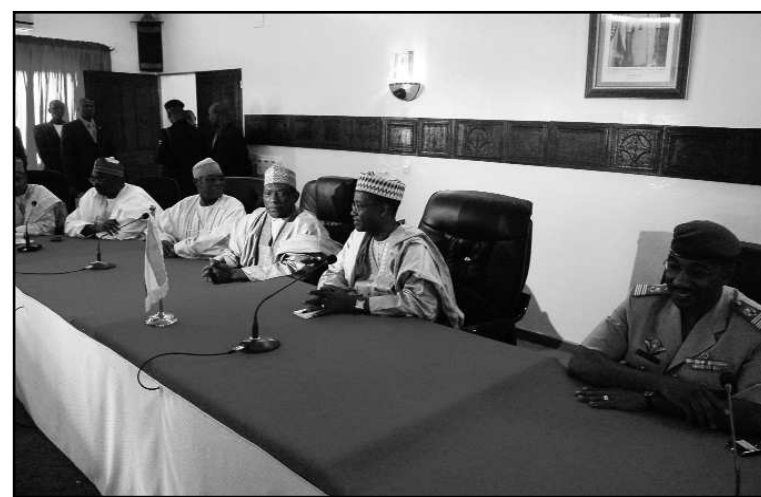
... et enfin avec la délégation de Kebbi (Nigeria).