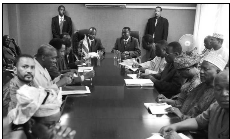
Le Premier ministre au Ministère en charge de l'Enseignement Supérieur...

route comprenant notamment les objectifs principaux et spécifiques que chaque département doit atteindre durant la période de transition politique. A chaque rencontre, le Premier ministre fait d'abord une introduction pour expliquer le motif de son