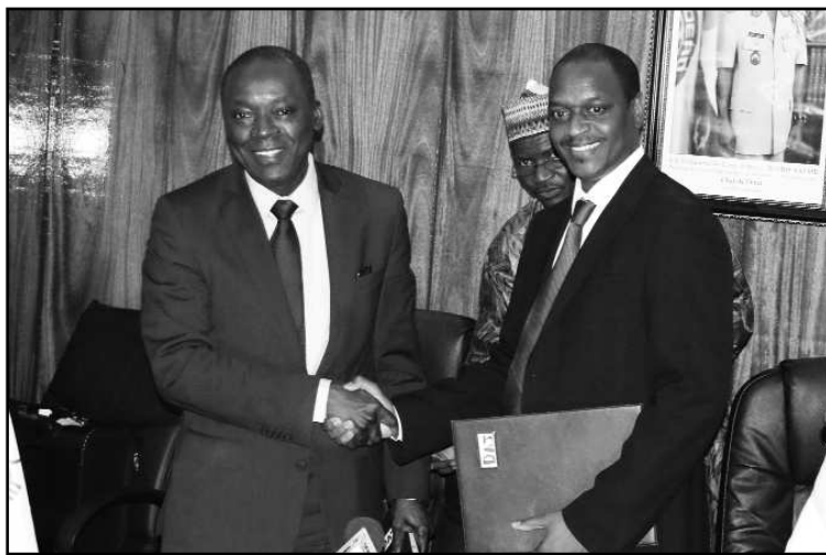
Lors de la signature de la convention, hier

Institution n'a cessé de multiplier ses interventions dans le développement économique et social du Niger. En témoigne l'état actuel du portefeuille des projets qui totalisent presque 50 milliards de Francs CFA répartis aux secteurs des infrastructures routières et hydrauliques ainsi que de la sécurité alimentaire. Dans le domaine des infrastructures, les projets en cours sont: le Projet d'Aménagement et de Bitumage de la Route Niamey-Ouallam pour un montant de quatre milliards cinq cent millions (4.500.000.000) de francs CFA ; le Projet d'aménagement et de bitumage de la route Madaoua-Bouza-Tahoua pour un montant de quatre milliards (4.000.000.000) de francs CFA ; le projet d'aménagement et de bitumage de la route Bella-Gaya-frontière du Bénin pour un montant de huit milliards (8.000.000.000) de francs CFA; le programme Kandadji de régénération des écosystèmes et de mise en valeur de la Vallée du Niger pour un montant de dix milliards (10.000.000.000) de francs CFA. Au regard de ces importantes interventions dans les secteurs clé de notre économie, je peux affirmer que notre coopération se porte bien", a affirmé le ministre en charge des finances. Intervenant auparavant, le président de