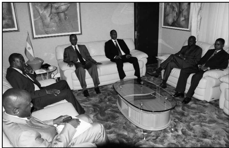
... avec le président de la BOAD (2 ème à gauche)...