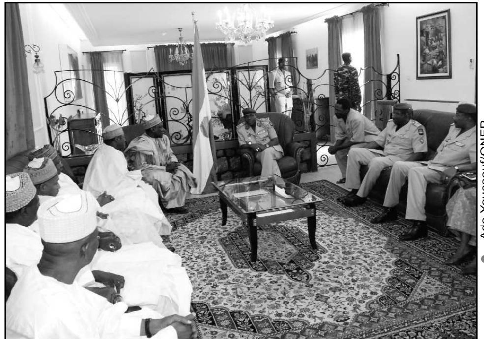
... et avec les membres de la délégation de Kebbi.