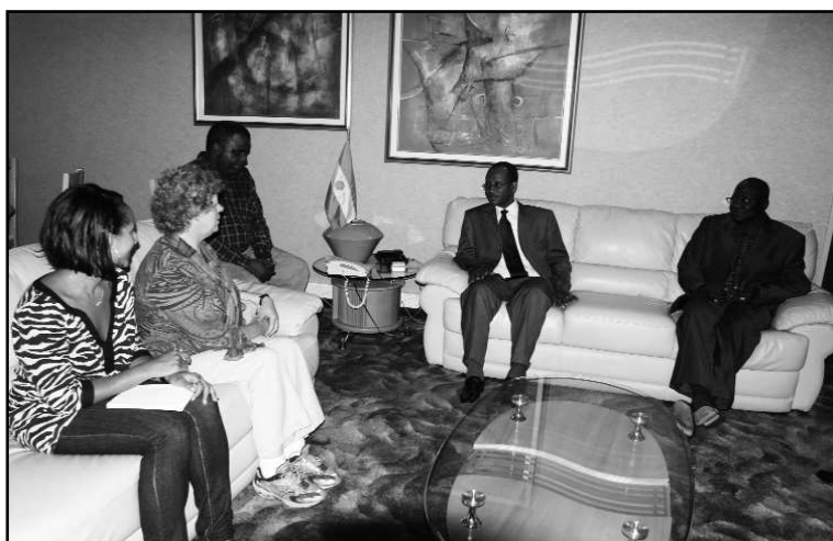
Le Premier ministre avec la Directrice Exécutive du Bureau National de Plan International pour le Royaume Uni (2 ème à partir de la gauche) ...