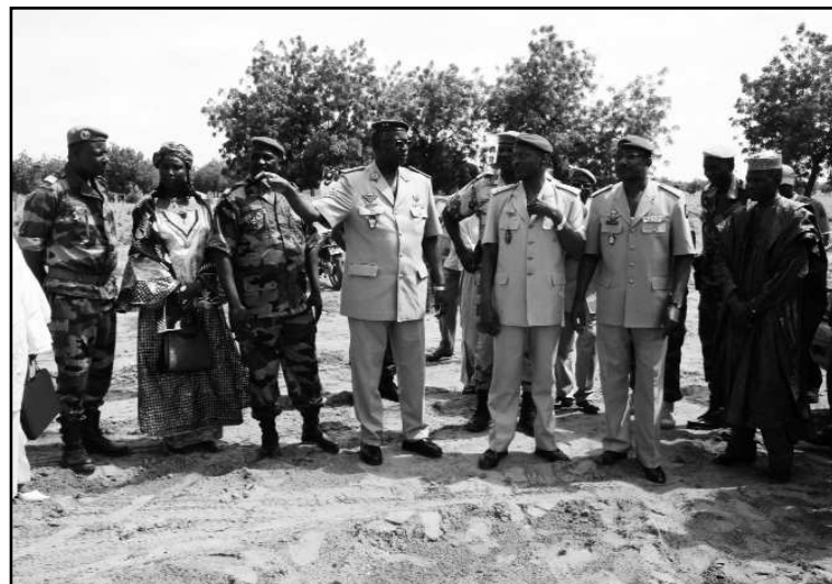
La délégation ministérielle sur le site, hier