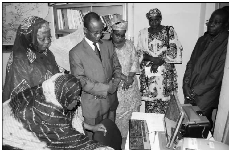
... et au Ministère de l'Education Nationale, hier.

déplacement, parler du contexte dans lequel se situe l'action gouvernemental tout en appelant le ministre et les hauts responsables à leur devoir et mission qui sont plus que jamais nécessaires pour conduire à bon port la transition politique. « Cette période de transition, a fait observer le