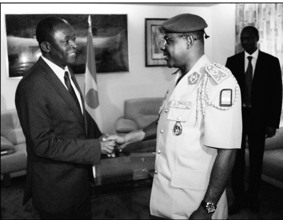
Le Chef de l'Etat avec le président de la BOAD...