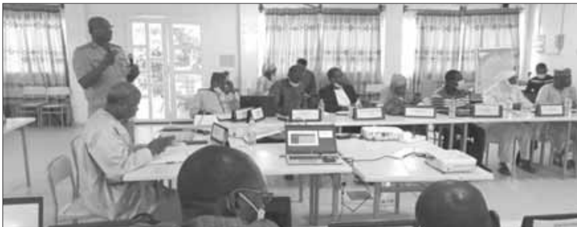
Les participants lors des travaux de l'atelier de formation

Le Haut-Commissariat à la Modernisation de l'Etat a organisé du 04 au 07 octobre 2021 à Dozzo un atelier de formation en Evaluation Rapide. Cet atelier qui a regroupé les cadres de l'administration publique, des institutions de la République, des projets et programmes et des organismes de coopération avait comme objectif de contribuer au développement des capacités des acteurs nationaux sur cette nouvelle forme d'évaluation.