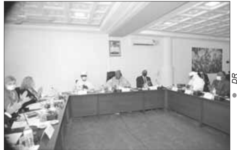
Le Premier ministre (centre) dirigeant la réunion

Le troisième pilier de cette feuille de route est aussi en bonne voie au Niger, parce que « l'opération de retour des déplacés dans leurs villages va se poursuivre jusqu'à la fin de l'année », a rassuré le premier ministre. Il