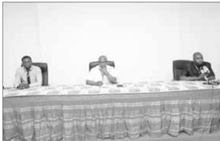
Lors du lancement de l'atelier

Des acteurs en charge du suivi-évaluation et de la communication, des opérateurs de mise en œuvre du programme PAPBio (Programme d'appui pour la préservation de la biodiversité et les écosystèmes fragiles, à la gouvernance régionale et au changement climatique en Afrique de l'Ouest) prennent part à un atelier de formation qu'organise ledit programme du 12 au 15 octobre 2021 à Niamey. PAPBio est un programme de 11 projets financés par l'Union Européenne au profit des Etats membres de l'UEMOA, la CEDEAO, à hauteur de 54 millions d'euros.