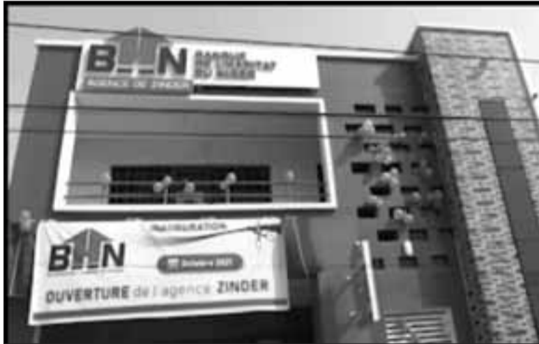
Agence de la BHN-Zinder