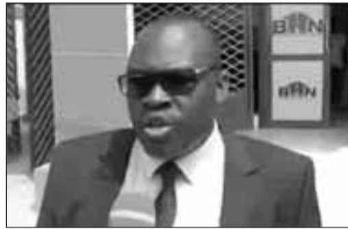
Chef d'agence BHN-Zinder

La création de la BHN s'inscrit dans le cadre des dispositions de la loi N°98-054 du 29 décembre 1998 à la Politique Nationale de l'Habitat et du Développement Urbain.