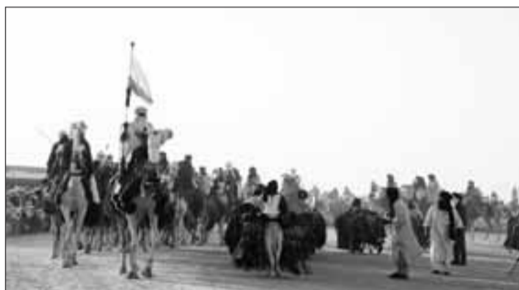
Les chameliers défilant lors de la Cure salée

meau de la 56 ème édition de la Cure Salée M. Silimane Ouba Ahmou, a précisé que le temps de la fantasia est un moment de réjouissance où tous les éleveurs des campements se rencontrent. Pour immortaliser la rencontre des courses de chameaux sont organisées. «La Cure Salée c'est la transhumance des éleveurs qui viennent des régions sud en passant par les régions nord notamment l'Irhazer pour conduire leurs animaux dans la zone salée afin qu'ils puissent faire leur cure de sel. A la fin de la consommation de la cure généralement l'événement est marqué par une fête où les chameaux sont au centre. On choisit les chameaux et les ânes les mieux harnachés pour la circonstance. La Fantasia consiste à faire un schéma de présentation devant le public de manière à refléter comment elle a coutume d'être tenue