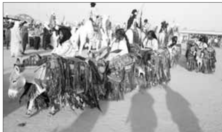
... les femmes défilant fièrement à dos d'ânes richement harnachés

Le Tendé, facteur de cohésion communautaire des nomades est un instrument traditionnel simple. Il est fait d'un assemblage d'une peau tannée de mouton ou de chèvre tendue sur un mortier en bois sur lequel deux pilons attachés en opposé à l'aide d'une corde et disposés perpendiculairement en vue de produire un son de tambour réglable à volonté par la pression exercée par le poids de deux