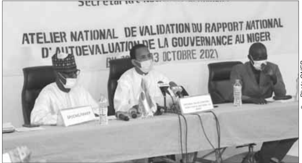
Le point focal MAEP (centre) présidant l'ouverture de l'atelier

Ces recommandations ont à leur tour servi de socle pour proposer un plan d'action que les acteurs auront à apprécier et améliorer sur la base des préoccupations et aspirations de peuple nigérien. Avant d'aboutir à ces documents de synthèse, a expliqué M. Oumar Moussa, les institutions de recherche