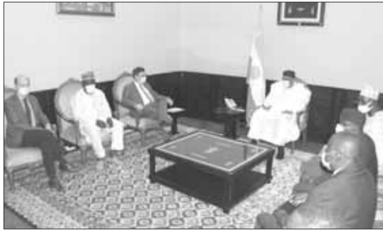
Le Chef de l'Etat avec ses hôtes

République d'Allemagne au Niger, le commissaire est là dans le cadre de l'inauguration de ce programme à l'Université Abdou Moumouni de Niamey qui a aura à former 60 jeunes. Il a précisé que ces étudiants issus de l'Espace CEDEAO commencent leur étude à Niamey notamment en ce qui concerne la production, l'utilisation, le transport relativement à l'hydrogène vert pendant les quatre années à venir. C'est dans ce sens que l'ambassadeur de la République d'Allemagne au Niger a dit que ces étudiants feront deux semestres à l'UAM puis un se-