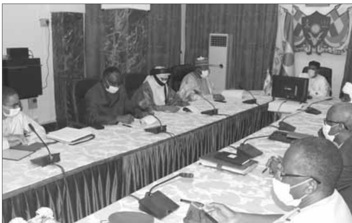
Une vue de la salle lors de la réunion du Conseil

L e Président de la République, Chef de l'Etat, Chef Suprêmes des Armées, SEM Mohamed Bazoum, a présidé le mardi 12 octobre, au Palais de la Présidence, une réunion du Conseil National de Sécurité (CNS). Cette réunion regroupe autour du Chef de l'Etat, outre le Premier ministre, Chef du gouvernement, plusieurs membres du gouvernement et des Hauts responsables des Forces de Défense et de Sécurité (FDS).