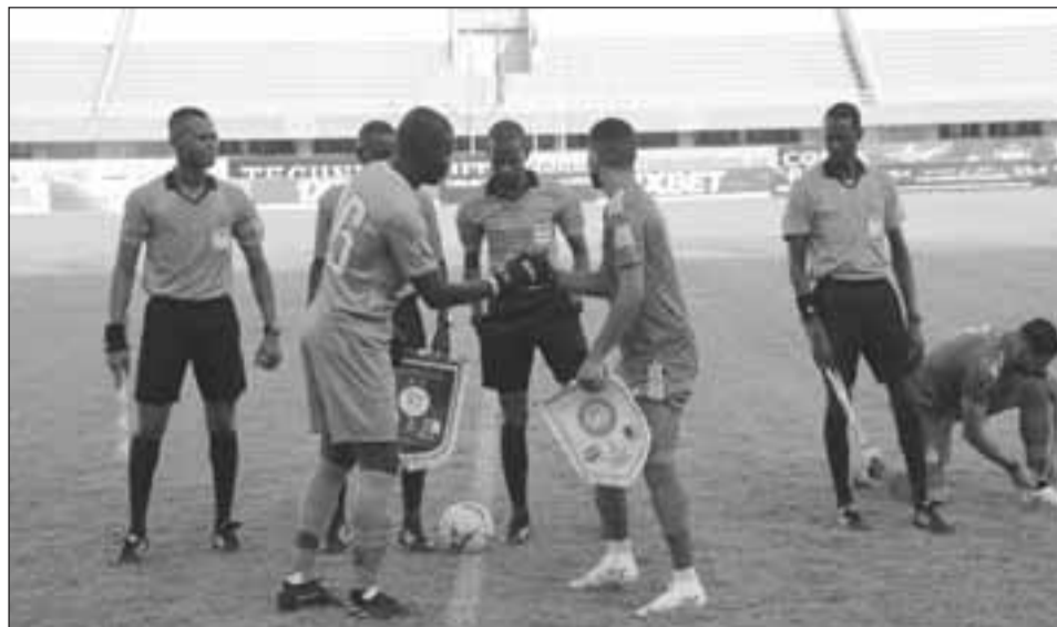
Echange de fanions entre les deux capitaines, en debut du match

Le Mena a commencé à perdre de plus en plus de crédibilité vis-à-vis de son public. L'équipe nationale du Niger est connue ces dernières années par son inefficacité avérée. La beauté du jeu importe peu, l'essentiel, est de remporter la victoire. Les supporters ont quitté le terrain sous l'effet de colère avec le sentiment d'être humiliés. Au regard de la