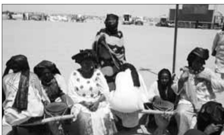
Au rythme du mythique Tendé ...