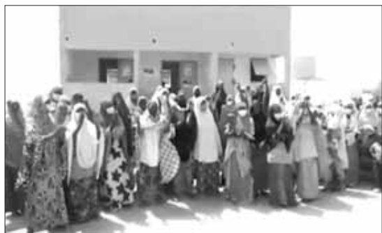
Les bénéficiaires du projet ont organisé des réjouissances populaires pour se féliciter de sa réussite et de sa démarche

La sensibilisation, faut-il le préciser a touché 170.000 personnes dans les différents villages et 7400 personnes ont été formées sur le dépistage de la malnutrition. Dans le même ordre d'idées, les médecins chefs des districts sanitaires des départements de Belbédji, de Tanout et Gouré se