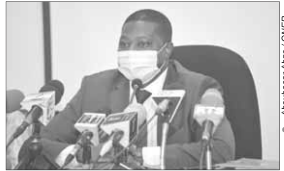
Pr Narey Oumarou

Par rapport au contrôle des opérations des collectivités territoriales, le président de la Cour des Comptes explique que le contrôle a porté sur la gouvernance locale, la gestion administrative, la gestion budgétaire et comptable ainsi que la gestion domaniale. Ici, la Cour des comptes relève par rapport à la gouvernance locale et la gestion administrative l'absence de tenue des sessions de certains conseils municipaux ; l'absence d'arrêtés portant organisation et fonctionnement des services des communes contrôlées. S'agissant de la gestion domaniale, budgétaire et comptable, le rapport général public 2020 de la Cour des Comptes précise qu'elle est caractérisée par un certain nombre d'irrégularités, singulièrement l'absence d'autorisation préalable au lotissement ainsi que le manque de viabilisation des sites lotis et des anomalies dans la procédure d'élaboration et d'exécution des budgets communaux ainsi que la reddition des comptes des collectivités territoriales contrôlées. En ce qui concerne le contrôle des établissements publics à caractère industriel et commercial, sociétés d'Etat, sociétés d'économie mixte, des établissements publics à caractère social, des projets et programmes de développement, le