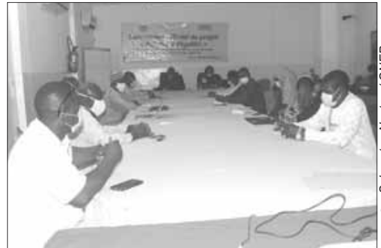
Une vue des participants à l'atelier

Face à ces différents défis et conscientes des risques, les autorités nigériennes, se sont résolues à promouvoir le droit des filles et garçons à l'éducation y compris en période de crise. Aussi, les Ministères en charge de l'éducation ont élaboré des plans de réponse prenant compte l'égalité de genre et l'inclusion. En somme, selon lui, le projet "Initiative pour l'égalité de genre dans l'éducation au Niger" qui a été lancée en juillet 2019 par les ministères de l'éducation et du développement du G7, en collaboration avec des organisations multilatérales et de la société civile engagées à promouvoir l'égalité entre les sexes dans l'éducation, traduit l'engagement de Plan International Niger à mobi-