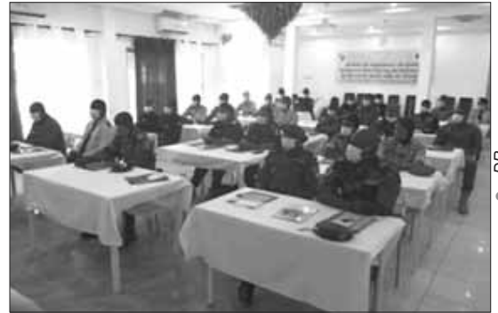
Lors de la formation

5. Les mécanismes de contrôle , permet de vérifier si les normes de services sont respectés et si la chaîne de commandement est régulière.