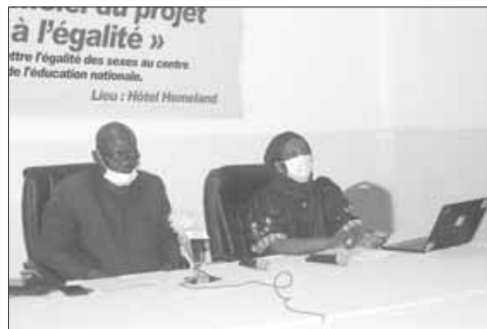
La table de séance à l'ouverture des travaux