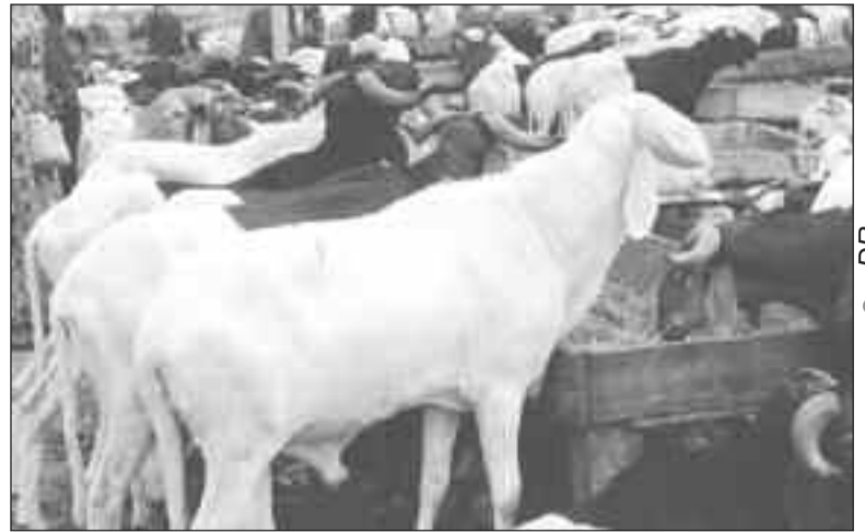
Abondance remarquable des moutons sur le marché

Comme dans d'autres pays musulmans, l'Aïd El Kebir ou fête de Tabaski, communément appelée fête de mouton, a été célébrée au Niger le dimanche 11 août dernier. Les jours qui ont précédé cette fête, les différents marchés à bétail de Niamey étaient les lieux les plus fréquentés. Même les rues de la capitale étaient envahies par les vendeurs des moutons, malgré l'interdiction des autorités municipales. Les chefs de ménage se sont battus pour se procurer le précieux bélier destiné au sacrifice et cela proportionnellement à leur bourse. Malgré la disponibilité des moutons leurs prix étaient hors de portée. Les béliers du sacrifice, coûtaient de 50.000 à 300.000 voire 500.000 FCFA. Mais du fait de l'abondance des moutons et sans doute de leurs prix élevés, il y a eu une situation de mévente.