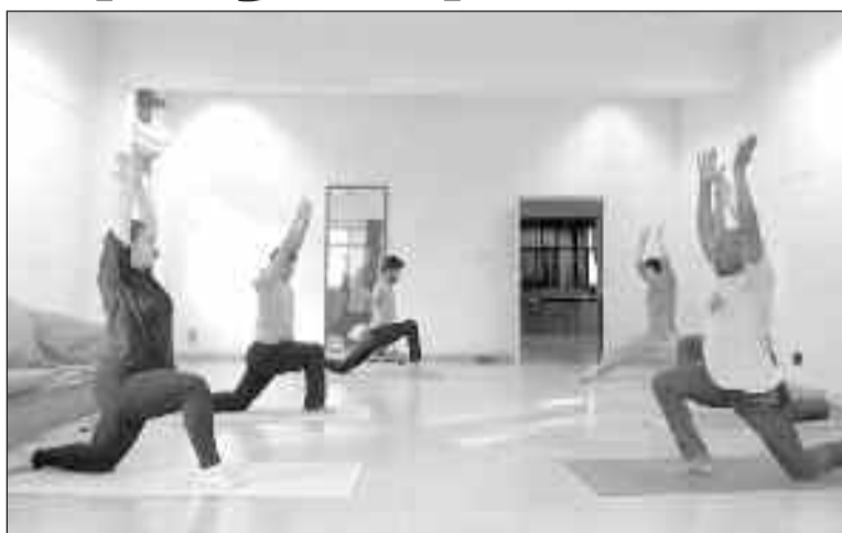
Une séance de Yoga

Quels sont ses bienfaits ? Les bienfaits du yoga sont essentiellement dans ce qu'elle procure à l'homme, un bien-être physique et mental au quotidien. Chacune de milliers de postures préconisées et exécutées dans la pratique, a une vertu, un rôle à jouer pour la santé ou le bien-être de la personne. La leçon du yoga la plus connue, la plus simple et la plus