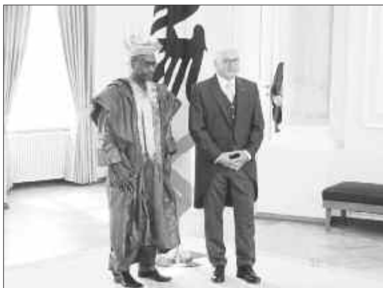
Lors de la présentation des lettres de créance