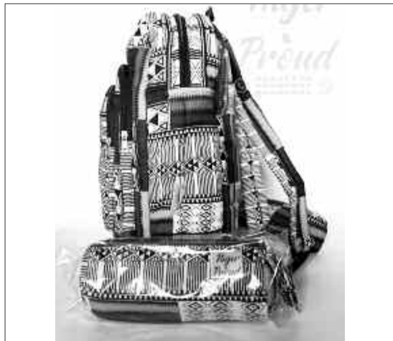
... et de Kounta Téra Téra

Une initiative qui mérite d'être encouragée Iro artiste conteur, un consommateur des produits locaux apprécie positive-