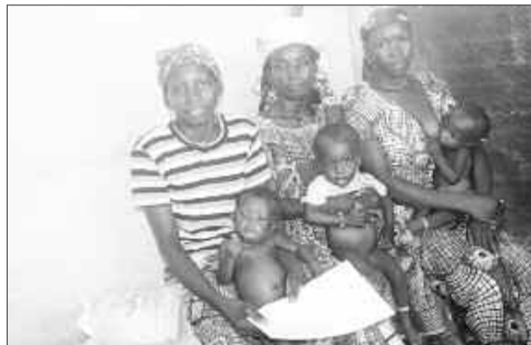
Lors d'une consultation dans un CSI