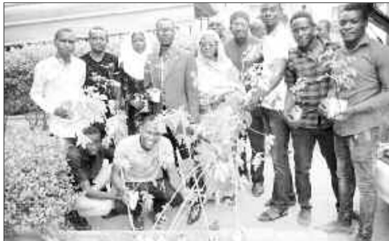
Photo de famille peu après la réception des plants

L'AJDE exécute ses activités en fonction de son programme, l'objectif principal étant de promouvoir la jeunesse et de revaloriser la culture nigérienne. Ainsi L'AJDE avait mis en œuvre de 2011 à 2015 le PAE (programme d'accompagnement éducatif) qui regroupe les projets comme : le concours d'épellation « épelle moi zone 5 », réalisé à travers les 5 arrondissements de la région de Niamey et dont l'objectif est d'améliorer le niveau en français parlé et écrit des scolaires ; le forum de l'orientation et des métiers organisé chaque année afin d'aider les élèves en classe d'examen (3ème et terminale) à faire un choix judicieux vers la suite de leurs études. Le forum s'articule sur 3 thèmes à savoir : Comment choisir sa filière après le Bac ou quelle option après le BEPC, la problématique du système LMD, les filières d'études porteuses au Niger ; l'émission télévisée la galaxie du savoir, sur la télévision Canal 3 TV et dont l'objectif est d'amener les scolaires à croître leur niveau de culture générale et développer l'esprit de compétitivité en eux. Dans le domaine de l'environnement, l'Alliance des jeunes pour un