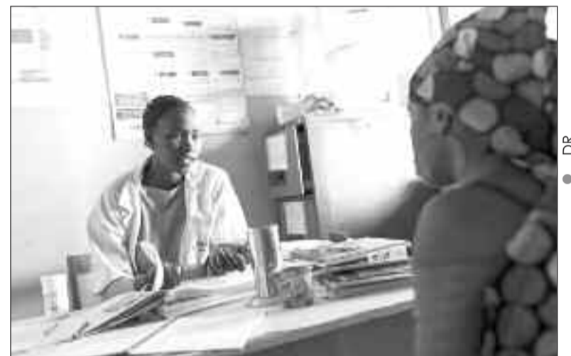
Une sage-femme donnant des conseils d'usage à une jeune femme