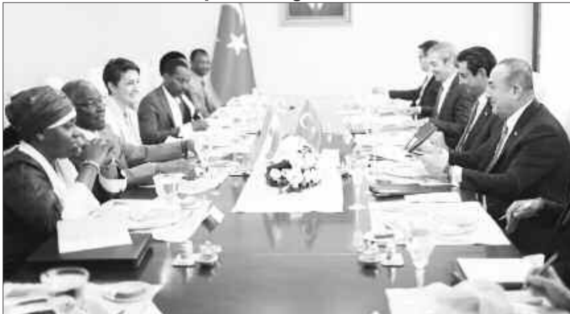
Lors de la séance de travail entre les deux parties

Le ministre des Affaires Etrangères, de la Coopération, de l'Intégration Africaine et des Nigériens à l'Extérieur, SEM. Kalla Ankourao, a effectué, du 14 au 17 août 2019, une visite officielle de travail à Ankara (République de Turquie). Il était accompagné dans ce déplacement de ses proches collaborateurs et de deux Conseillers à la Primature.