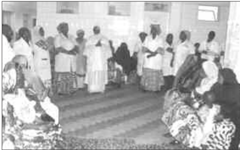
Lors d'une campagne de sensibilisation

En plus des bénéficiaires, elle pense aussi que les prestataires, doivent être formés pour être en mesure de bien jouer leur rôle. La disponibilité des produits contraceptifs au niveau des formations sanitaires et des cases de santé est un autre facteur important pour réussir la promotion de la PF post partum au Niger. Surtout que, « nous avons des distributeurs appelés relais communautaires qui distribuent les produits contraceptifs par voie orale dans les villages ». C'est en somme plusieurs activités qui sont menées pour permettre