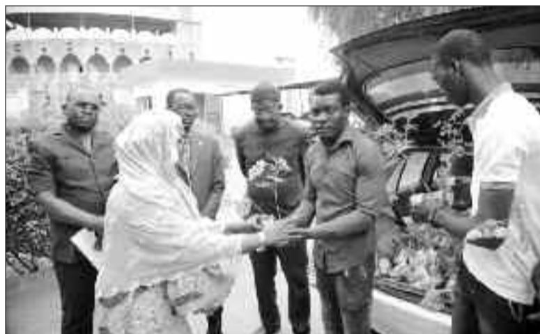
Les membres de l'AJDE accueillis à l'entrée des locaux de l'ONEP

l'AJDE s'est engagée à accompagner les efforts de l'Etat dans son combat pour créer un cadre de vie approprié aux populations. A cet effet, l'AJDE a offert à l'ONEP 120 plants de Moringa et 40 plants de papayer.