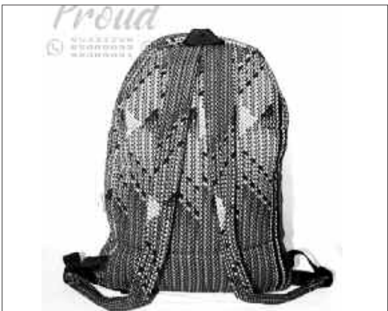
Un échantillon de sac fabriqué avec le pagne Sayi Tangara ...