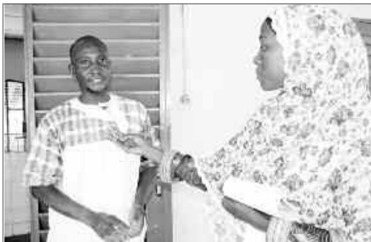
Lors d'une séance de cours dans un établissement

examens de fin d'année. Les cours ont débuté il y a une semaine. Certains élèves saluent cette initiative : « j'ai opté pour les cours de vacances que de rester à la maison sans rien faire. En fait, depuis le début de ces cours je suis motivé à faire beaucoup d'exercices, cela me permet d'être en avance sur le programme et d'avoir une idée