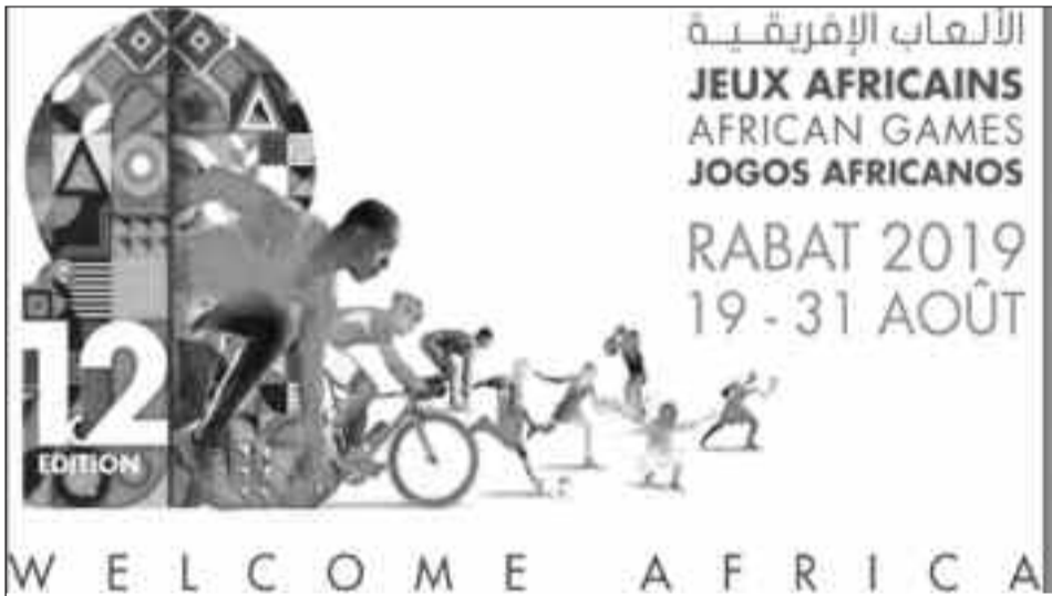
La mascotte des 12 èmes jeux africains de Rabat

issus de 52 pays du Continent (le Liberia et les Iles Comores ont décidé de ne pas y participer) qui disputeront 29 disciplines dont 17, seront qualifiantes pour les Jeux