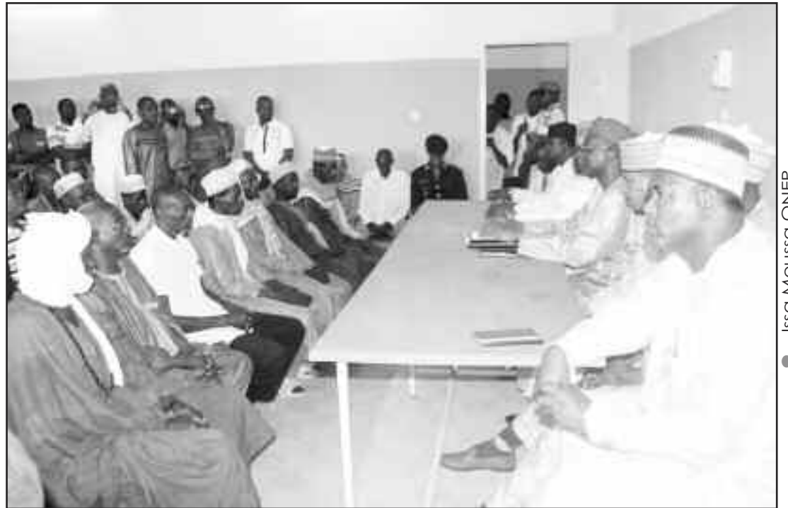
Rencontre entre les membres de la mission parlementaire et les populations

Les membres de la commission des Affaires Etrangères et de la Coopération de l'Assemblée nationale, ont entamé le 20 Août dernier une mission parlementaire d'information et de sensibilisation à l'endroit des populations dans les régions de Tillabéri et Niamey sur les sujets d'intérêt national, notamment l'unité nationale, la cohésion sociale, la paix et la sécurité. Cette mission