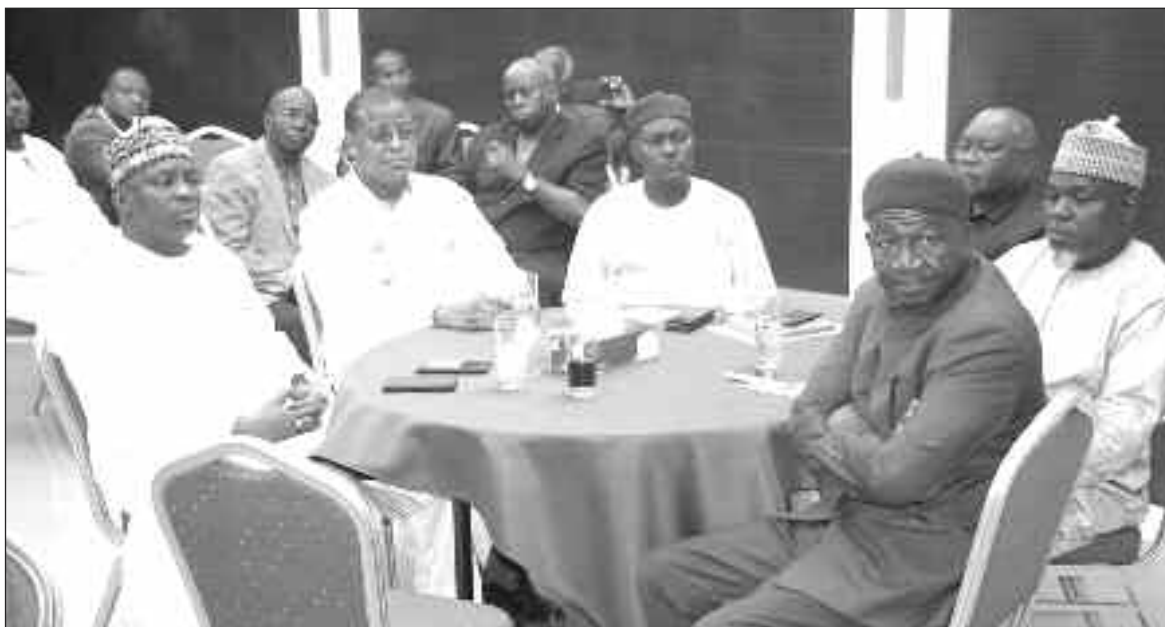
Le ministre de la Communication et des responsables des médias lors de la conférence de presse

chinoise » en renforçant son économie, sa puissance nationale ainsi que son imposante contribution à l'essor économique mondial.