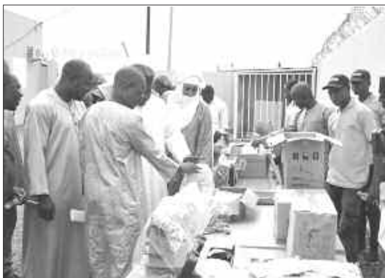
Cérémonie de réception de 75 machines à coudre et des outils pour la...