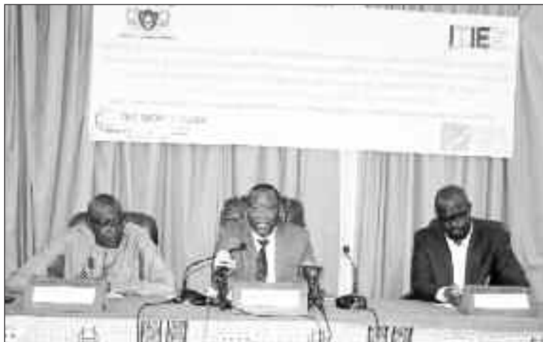
La table de séance

En raison d'un déficit de communication, faut-il le rappeler, le Niger a été suspendu du processus ITIE en 2017, avant d'annoncer son retrait. Suite à des discussions franches et directes entre le Niger et le secrétaire exécutif de l'ITIE, ce malentendu a été dissipé dans l'intérêt des deux parties. De cet fait, « la résolution a été prise d'apporter les correctifs nécessaires, de part et d'autre, afin de marquer un nouveau départ. Dans cet ordre d'idées et déterminé à jouer sa partition, le Gouvernement a immédiatement entrepris la réforme du secrétariat permanent de l'ITIE qui a abouti à la mise en place d'un nouveau dispositif