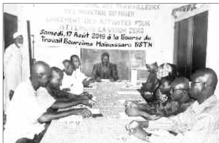
Lors de la cérémonie