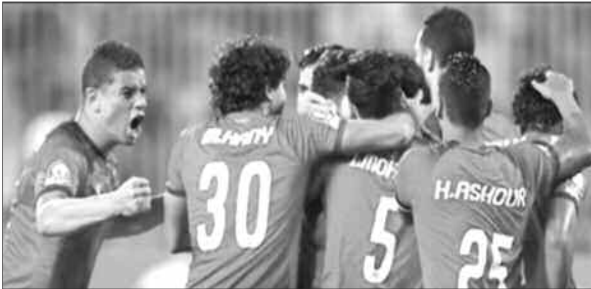
Les joueurs de Ahly en liesse lors d'une victoire précédente

Le géant égyptien Al Ahly, qui a déjà un pied au premier tour, accueillera les Sud-Soudanais d'Atlabara ce week-end lors du match retour du tour préliminaire de la Ligue des Champions Total CAF au stade Borg El Arab, à Alexandrie.