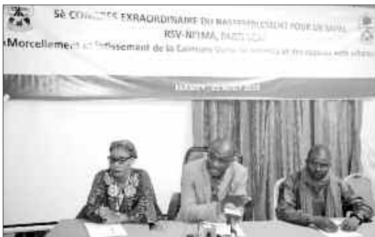
Le président du parti ( au centre)

en son temps et pris la courageuse décision suivie immédiatement par des plantations d'arbres avec le soutien des partenaires du Niger. « On peut, effectivement, toujours parler de Ceinture Verte même si il y a actuellement plus de 14.000 villas construites dans l'emprise de celle-ci et que la ville s'est étendue au-delà de cet espace. Selon lui, la Ceinture verte souffre de plusieurs maux. D'abord son abandon par les pouvoirs publics aux spéculateurs fonciers. Spéculateurs privés et publics, qui ont procédé au morcellement et au lotissement de la Ceinture Verte. « La Ceinture Verte est aussi transformée en décharge municipale où sont déversées toutes les ordures solides et liquides de la ville de Niamey. Elle fait également l'objet d'occupation illégale à la fois par une catégorie d'artisans (mécaniciens, fabricants de briques...) mais aussi par de simples particuliers », a-t-il dé-