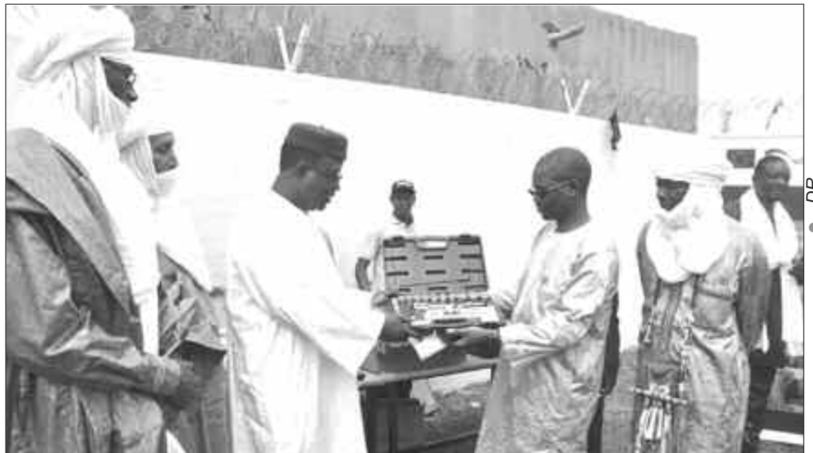
... mécanique et de 100 manuels