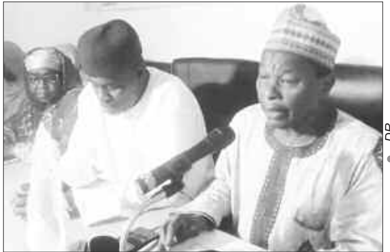
Lors de la cérémonie de mise en place