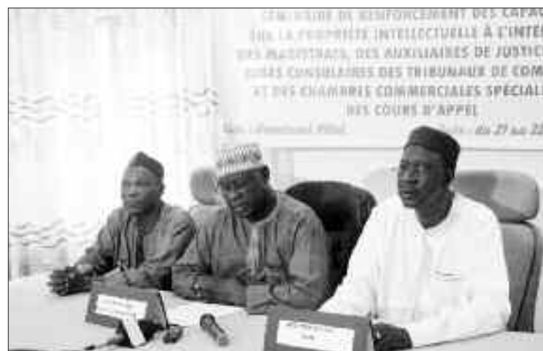
Lors de l'ouverture du séminaire