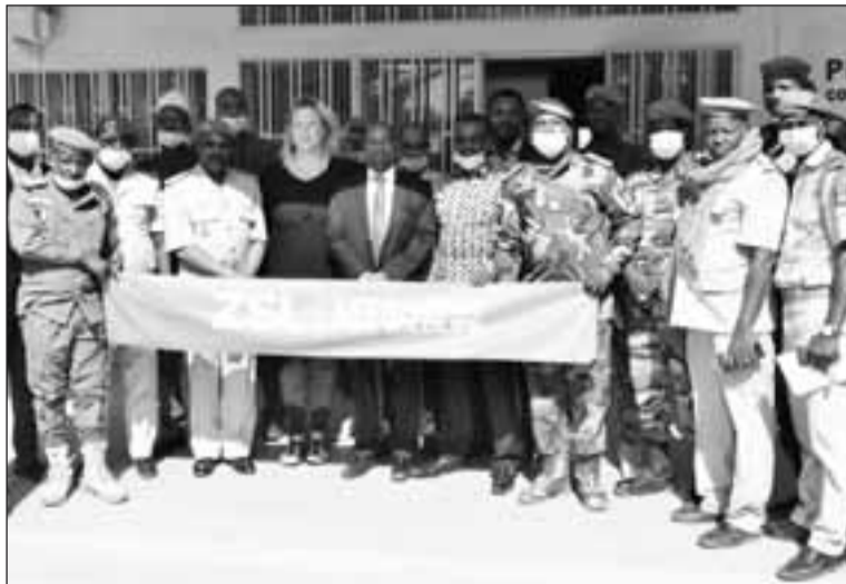
Photo de famille des participants à l'ouverture de l'atelier