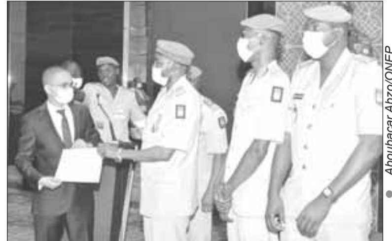
Le ministre des Finances remettent un certificat de mérite à un douanier