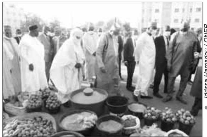
... des produits maraîchers d'Agadez exposés à la foire