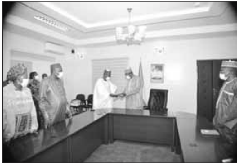
Le Premier ministre recevant le rapport du CESOC