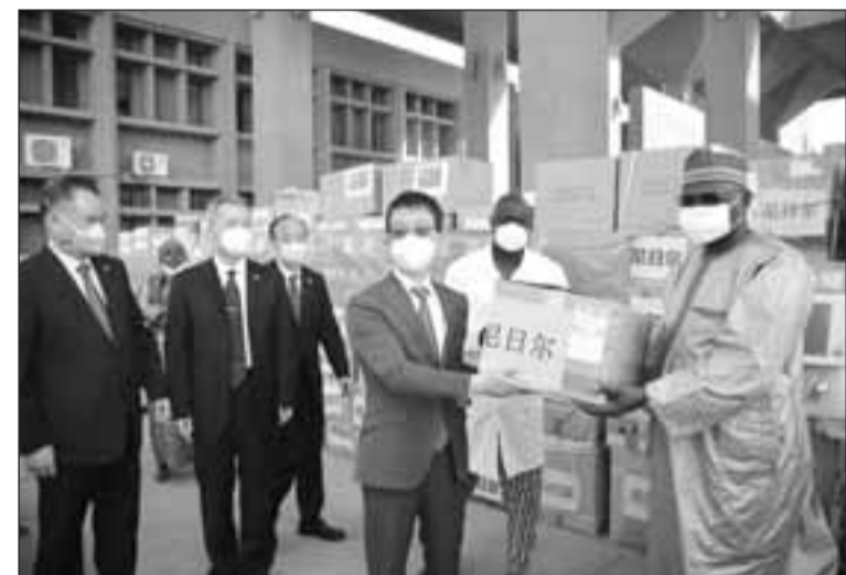
Lors de la remise symbolique du don