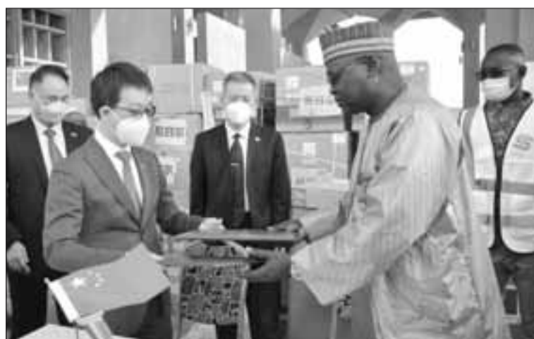
Echange de documents entre les deux parties