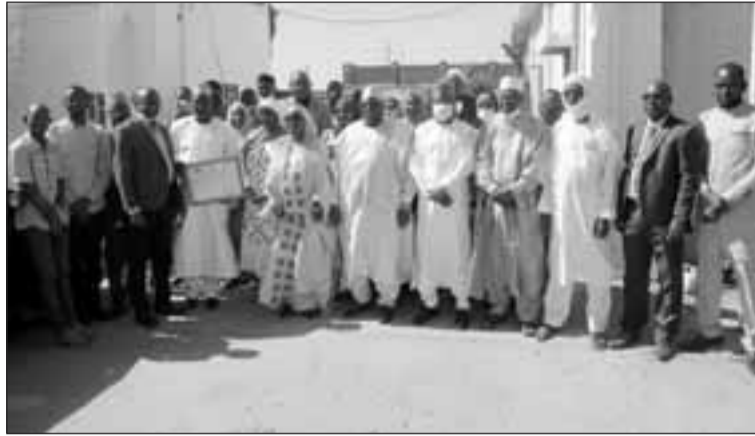
Photo de famille à l'issue de la présentation des vœux

par l'institution depuis sa création. A cet effet, a-t-il dit «ce succès, nous le devons à l'apport de vous tous. Chacun de vous, à son niveau de responsabilité a apporté sa contribution à l'édifice, et, j'ai la profonde conviction, que nous pouvons faire encore plus en redoublant d'efforts». C'est pourquoi, il a appelé le personnel au professionnalisme dans l'accomplissement de ses tâches respectives, à la loyauté et à l'honnêteté, vis-à-vis de l'institution, des supérieurs hiérarchiques et aux différents collègues de travail. Le président de la CNDH, a indiqué aussi que l'année 2022 s'annonce avec des défis multiples et multi-