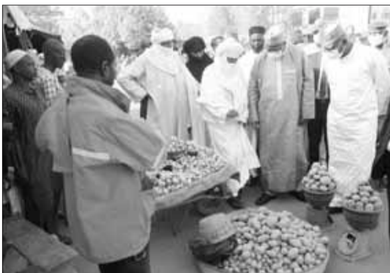
Le Premier ministre appréciant la diversité...

termes de qualité, des fruits et légumes ainsi que divers condiments et aromatiques exposés, reflètent à suffisance la capacité et la performance de la production