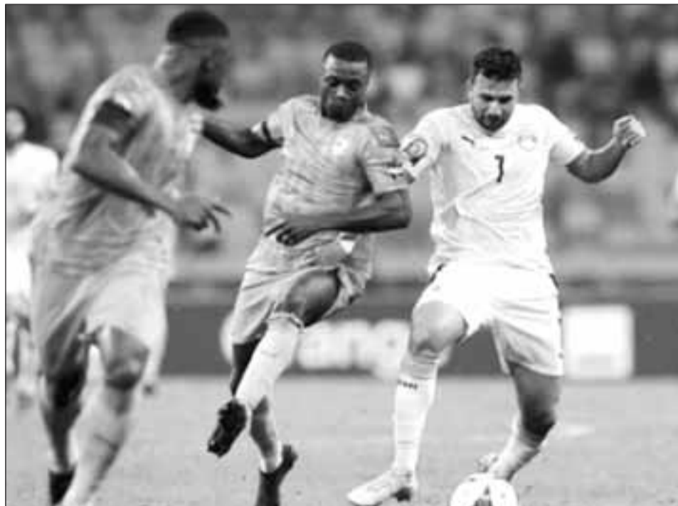
Une séquence du match Egypte-Côte d'Ivoire

Poussive durant la phase de groupes, l'Égypte s'est réveillée ce mercredi, pour s'offrir le scalp de la Côte d'Ivoire, en 8 èmes de finale de la CAN, après une séance de tirs au but (0-0, 5-4 aux t.a.b.). Mohamed Salah et ses coéquipiers affronteront le Maroc dimanche (17 heures).