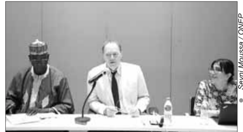
La table de séance à l'ouverture de la réunion