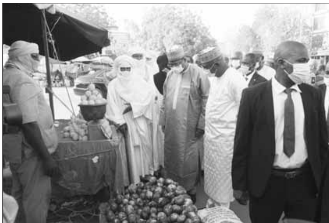
Le Premier ministre appréciant les produits maraîchers exposés à la foire

Apprécier la qualité, la diversité des produits exposés et encourager les producteurs